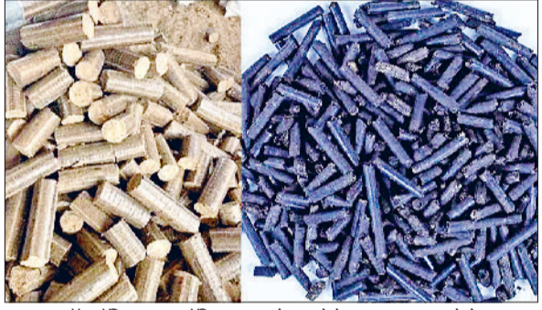
झज्जर। नॉन टॉरिफाइड व टॉरिफाइड बायोमास पेलेट्स का फाइल फोटो।