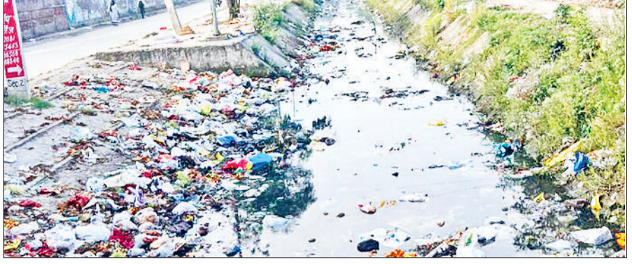
बहादुरगढ़। प्लास्टिक और कचरे से अटी नहर।

पॉलीथिन आदि सिंगल यूज प्लास्टिक का बढ़ता उपयोग गंभीर पर्यावरणीय समस्या का रूप लेता जा रहा है। यह प्लास्टिक न केवल गली-मोहल्लों की नालियों और सड़कों के किनारे बने नालों की निकासी को बाधित कर रहा है, बल्कि इलाके से गुजरने वाली नहरों तथा माइनरों को भी प्रदूषित कर रहा है। दरअसल,