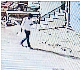
कैमरे में कैद संदिग्ध युवक।