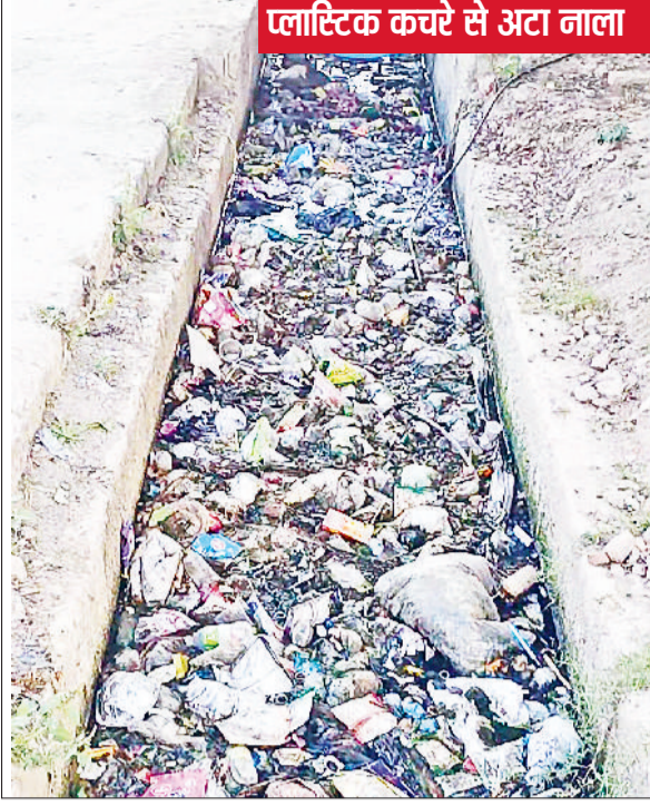
प्लास्टिक कचरे से अटा नाला