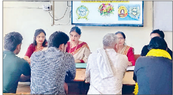
झज्जर। मीटिंग में उपस्थित अभिभावक एवं शिक्षक।

बहादुरगढ़। फाउंडेशन पब्लिक स्कूल में अंग्रेजी साक्षरता को बढ़ावा देने के उद्देश्य से अंग्रेजी साक्षरता के उपलक्ष्य में विशेष प्रार्थना सभा का आयोजन किया गया। कार्यक्रम में विद्यार्थियों ने विभिन्न सांस्कृतिक व शैक्षणिक प्रस्तुतियों के माध्यम से अंग्रेजी भाषा के महत्व और मानसिक स्वास्थ्य के प्रति जागरूकता का संदेश दिया। कार्यक्रम की शुरुआत ईश्वर स्तुति से हुई। इसके बाद सुविचार, प्रश्नोत्तरी, भाषण, कविता पाठ और गायन सहित भाषा के महत्व पर आधारित प्रस्तुतियों की श्रृंखला आयोजित की गई। कक्षा 12वीं के विद्यार्थियों ने मानसिक तनाव से बचाव का संदेश देते हुए प्रेरणादायक नृत्य प्रस्तुत किया। विद्यार्थियों द्वारा प्रस्तुत लघु नाटिका में वर्तमान समय में बढ़ते मानसिक तनाव और उससे जुड़ी समस्याओं को गंभीरता से देखते हुए विद्यार्थियों को पर्याप्त पानी और तरल पदार्थों का सेवन करने की सलाह दी। उन्होंने विद्यार्थियों को मतिव्यंघ में होने वाले कार्यक्रमों में भी बढ़-चढ़कर भाग लेने के लिए प्रेरित किया।