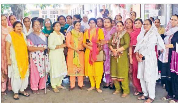
बहादुरगढ़। नगर परिषद कार्यालय में पहुंची आंगनबाड़ी वर्कर व हेल्पर।

वर्करों ने कहा कि सरकार उन्हें सरकारी कर्मचारी का दर्जा नहीं देती, फिर भी अतिरिक्त कार्यों का बोझ डाला जा रहा है। उनका कहना है कि सभी आंगनबाड़ी वर्कर और