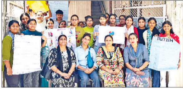
बहादुरगढ़। कार्यक्रम में मौजूद शिक्षक व सामाजिक कार्यकर्ता।