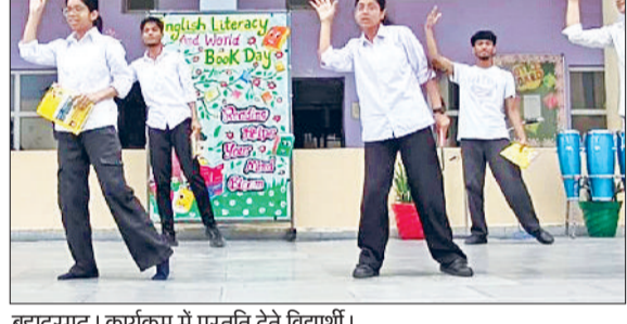
बहादुरगढ़। कार्यक्रम में प्रस्तुति देते विद्यार्थी।