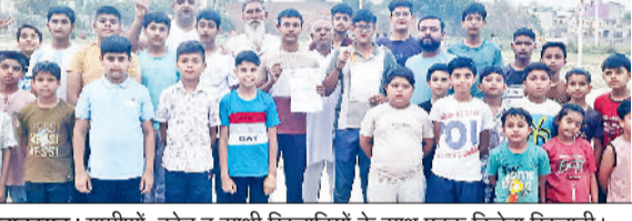
बहादुरगढ़। ग्रामीणी, कोच व साथी खिलाड़ियों के साथ पदक विजेता खिलाड़ी।

सांखोल के खिलाड़ियों ने जिला स्तरीय एथलेटिक्स प्रतियोगिता में शानदार प्रदर्शन करते हुए पदक जीतकर अपने गांव का नाम रोशन किया है। विजेता खिलाड़ियों का गांव में अभिनंदन किया गया।