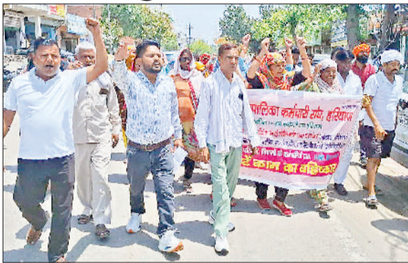
झज्जर। प्रदर्शन करते हुए सफाई कर्मचारी।