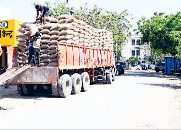
झज्जर। अनाज मंडी परिसर में गेहूं के उठान कार्य में जुटे श्रमिक।

जिले की अनाज मंडियों में उठान कार्य अब गति पकड़ने लगा है। डीसी स्वप्निल रविंद्र पाटिल ने अधिकारियों को निर्देश दिए कि खरीदे गए गेहूं का उठान और भंडारण कार्य में किसी प्रकार की अनियमितता बर्दाश्त नहीं की जाएगी। उन्होंने बताया कि जिले की मंडियों और खरीद केंद्रों में अब तक दो लाख 34 हजार 375 मीट्रिक टन गेहूं की आवक दर्ज, जबकि एक लाख 91 हजार 393 मीट्रिक टन से अधिक की खरीद व एक लाख 35 हजार 815 मीट्रिक टन गेहूं का उठान हो चुका है। उन्होंने बताया कि झज्जर अनाज मंडी में 64 हजार 600 मीट्रिक टन, बादली में 16 हजार 844 मीट्रिक टन, ढाकला में 14 हजार 982 मीट्रिक टन, बेरी में 50 हजार 879 मीट्रिक टन, मातनहेल में 35 हजार 869 मीट्रिक टन, माजरा डी खरीद केंद्र पर 21 हजार 396 मीट्रिक टन, छारा में 14 हजार 980 मीट्रिक टन, बहादुरगढ़ में 1 हजार