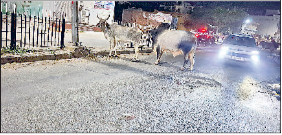
झज्जर। माता गेट क्षेत्र में सड़क के बीचों बीच खड़े बेसहारा गोवंश और पास से निकलते हुए वाहन।

जिला प्रशासन से बेसहारा गोवंशों को नदीशालाओं में भिजवाने की अपील की हरिभूमि न्यूज़ झज्जर